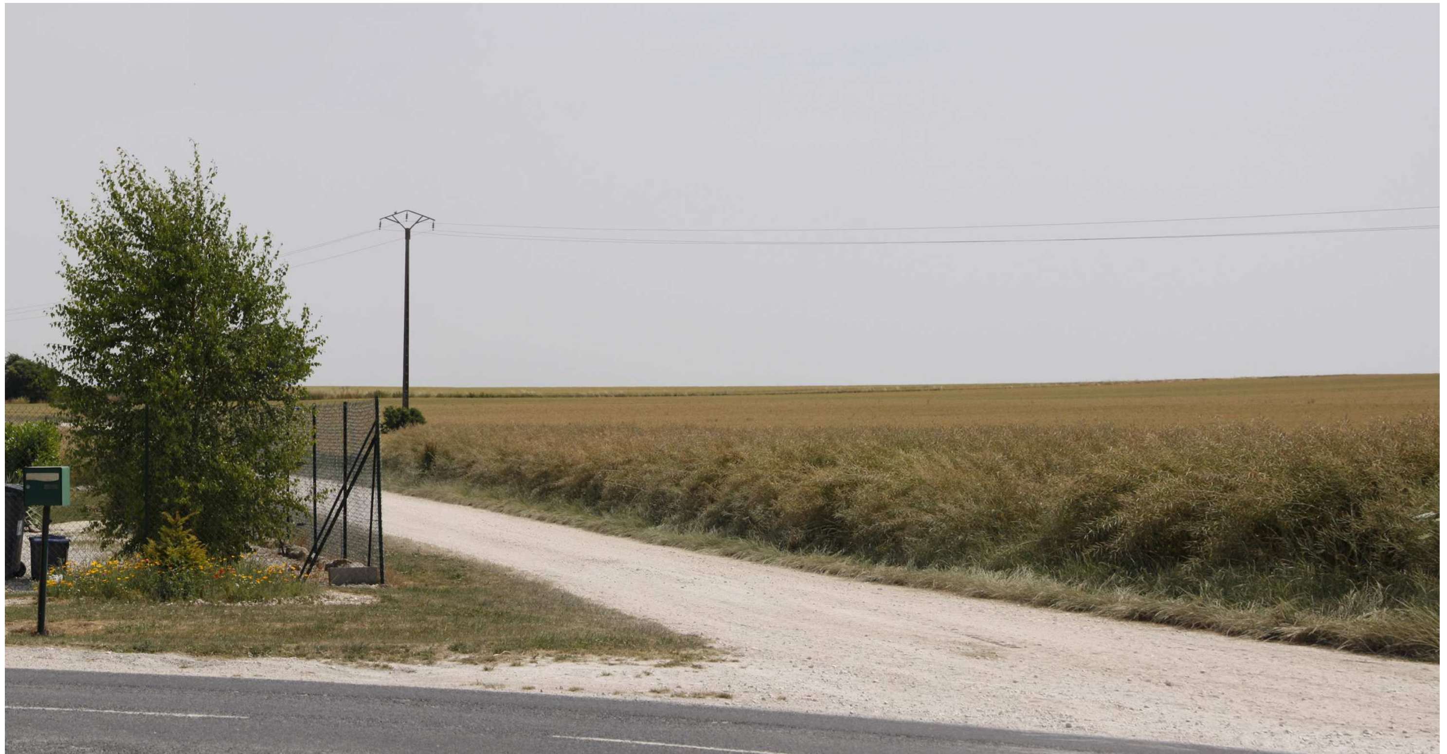
Le site actuel