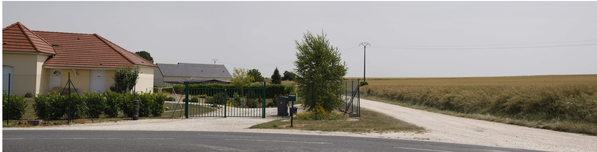
Le site actuel